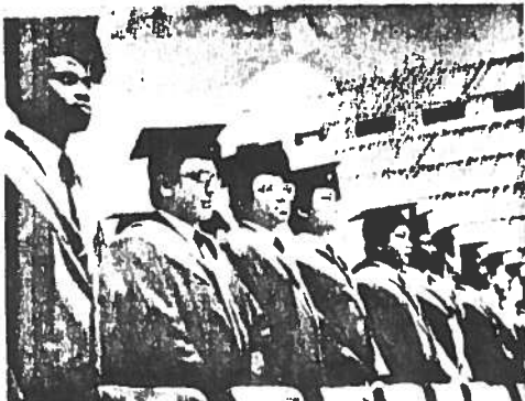
Människor från alla världens hörn fanns på plats när FN:s sjöfartsuniversitet i Malmö delade ut betygen till årets avgångselever.