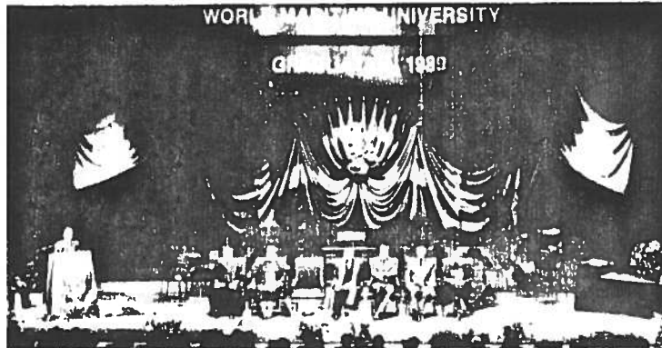
Det var en mycket högtidlig ceremoni på Malmö konserthus när avgångseleverna i går fick sina betyg.