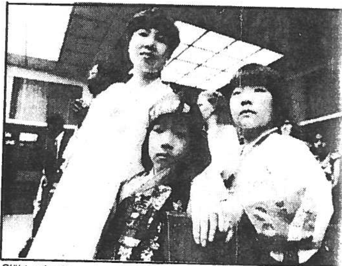
Släkt och vänner kom från jordens alla hörn för att fira de första studenterna som går ut från World Maritime University