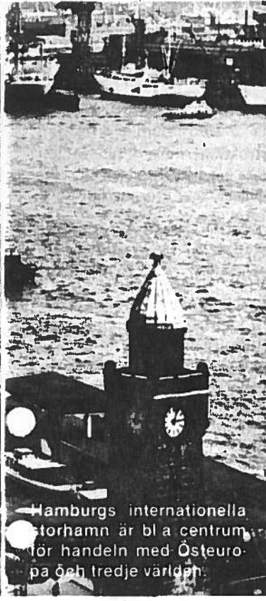
Hamburgs internationella storhamn är bl a centrum för handeln med Östeuropa och tredje världen.

FN-organet International Maritime Organization som ligger bakom detta unika sjöfartsuniversitet framhåller just att utbildningen är det viktigaste projektet i organisationens arbete för ökad sjösäkerhet och förbättrat skydd av havsmiljön mot föroreningar från fartyg.