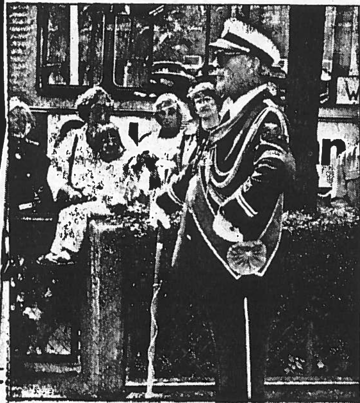
Vad står på här? Lockade av Malmö brandkårs musikkårs glada marschmelodier strömmade flånörer till universitetets invigningen.

— Enbart teknologi kan inte skapa säkra arbetsförhållanden. Det är utvecklingen av de mänskliga resurserna som förblir det huvudsakliga medlet när det gäller att använda och förbättra den moderna teknologin för detta ändamål. Jag hoppas att detta universitet ska främja en effektiv och säker internationell sjöfart.