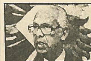
- Sjöfartsuniversitetet kommer att ge Malmö mycket god...

- Det var Malmös stora tillmötesgående som bådade för att Sverige fick världens första internationella sjöfartsuniversitet.