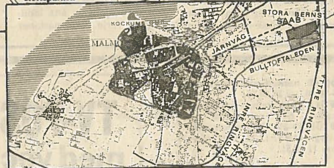
Förslaget som varken regering, Saab eller kommunledning kan tacka nej till, enligt Malmö Stadsmiljögrupp: bostäder m m på Kockums för 15 000 personer och Saab till en billigare och bättre tomt vid Stora Bernstorp.

Idéförslaget, vilket Stadsmiljögruppen tror starkt på ("Saab vill säkert inte framstå som en bromsklots för Malmö-regionen") förutsätter en rad saker: - Kockums Marin flyttas till Norra Hamnen ("Det finns större expansionsytor och är en bättre